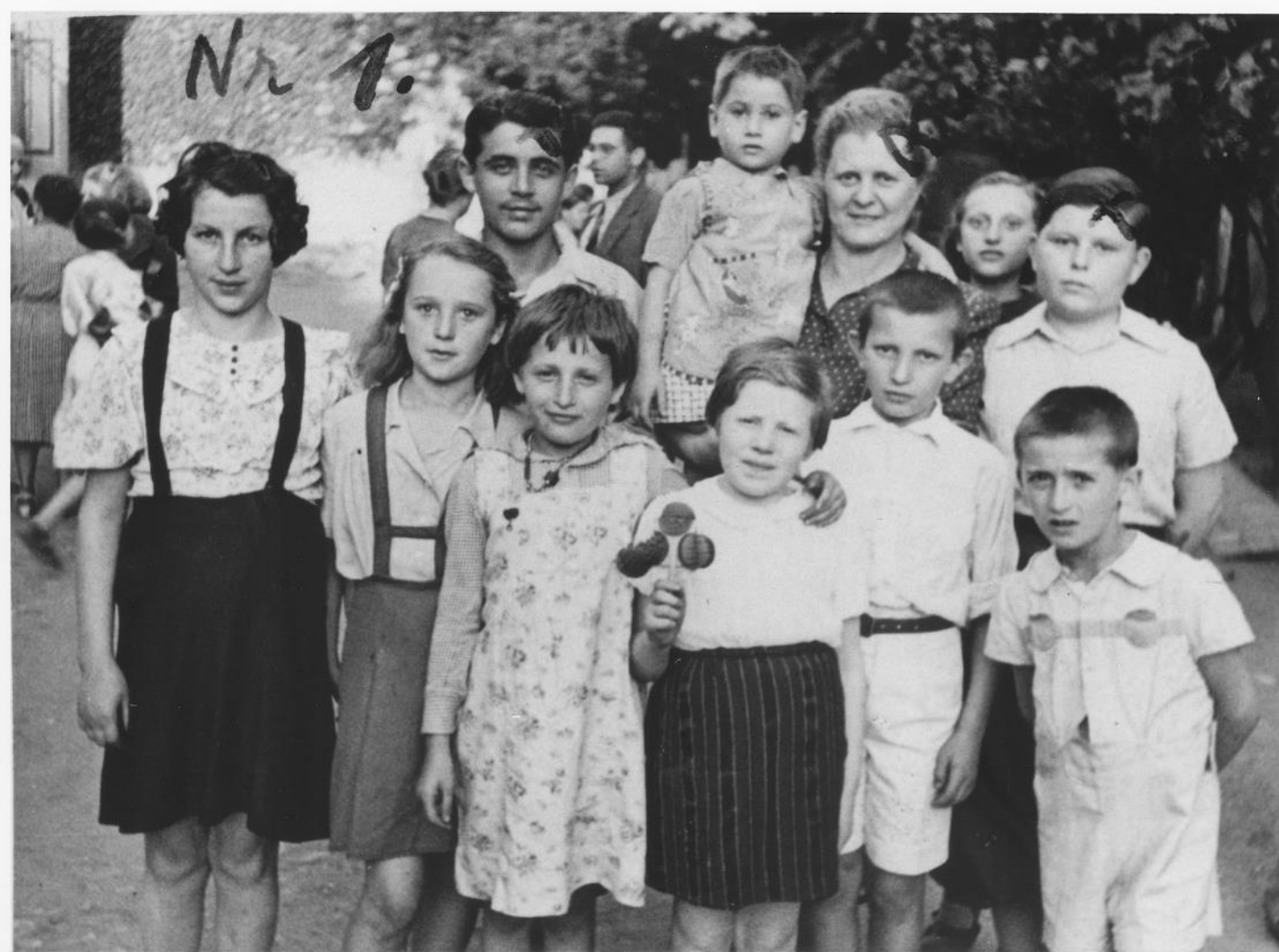
Grup de copii repatriați din Transnistria (martie – septembrie 1944)