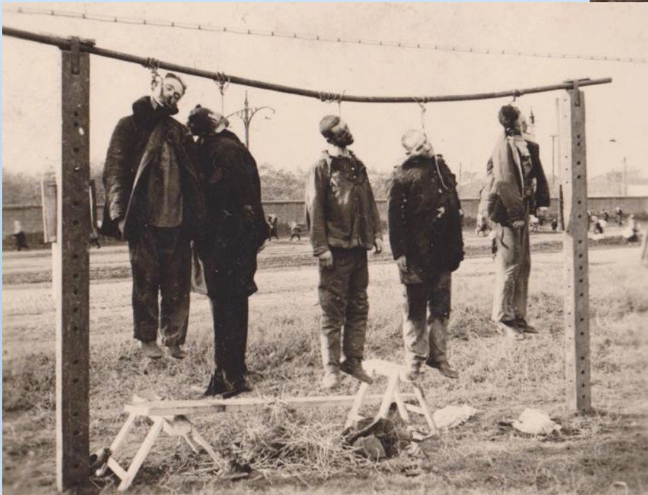
Evrei executați în Odessa.