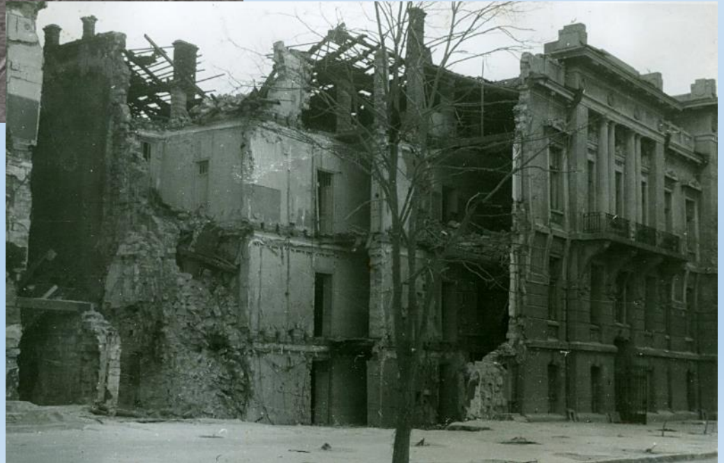
Clădirea comandamentului militar român distrusă de sovietici.