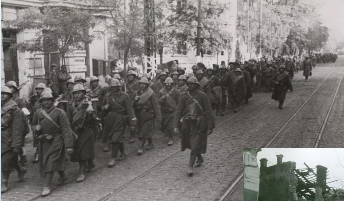
Intrarea trupelor române în Odessa.