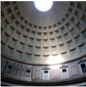
Panteon - Cupola