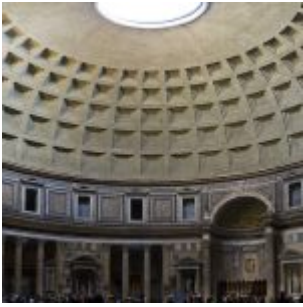
Panteon - Interior